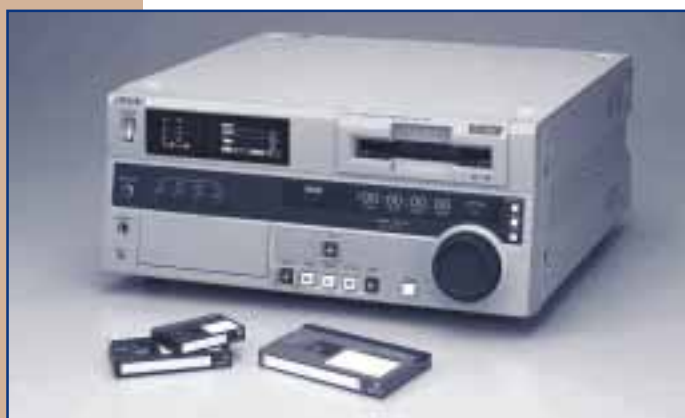
MODEL DEL DVCAM SÈRIE MASTER DE SONY AMB LES CINTES RESPECTIVES

En el món de la tecnologia digital, els usuaris cada vegada demanen més prestacions, característiques i tecnologies innovadores. Per donar cabuda a tots aquests requeriments, Sony ha desenvolupat i presentat la sèrie Master de magnetoscòpis. Aquesta sèrie es recolza en l'estàndard DVCAM de Sony,