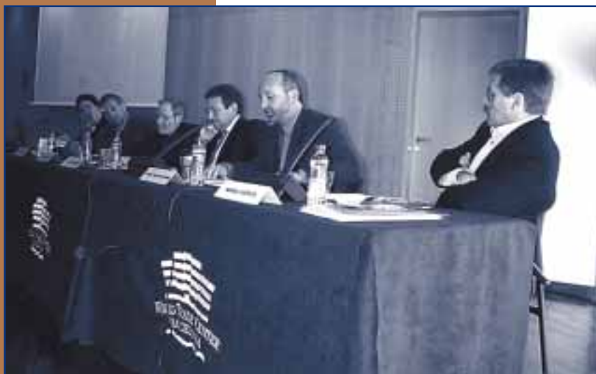
ACTE D'OBERTURA DE LES JORNADES

La jornada sobre les necessitats de formació a les ràdios locals de Catalunya, organitzada pel Sindicat de Periodistes de Catalunya i la Federació de Comunicació i Transport de la CONC, va tenir lloc al World Trade Center de Barcelona. El dia 23 es va fer a Girona, el dia 26 a Lleida i el 27 de febrer a Tarragona.