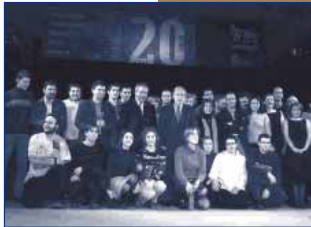
GUANYADORS DELS PREMIS DE COMUNICACIÓ LOCAL

La novetat d'aquesta edició va ser l'augment de la dotació econòmica per cada un dels premis que, per primera vegada, es va atorgar en euros. De fet, gairebé es va duplicar la quantitat de diners destinada als mitjans de comunicació i periodistes premiats. En concret, s'ha passat d'un total de cinc milions i mig de pessetes atorgats en l'edició de l'any 2.000 als més de nou milions que s'han repartit en l'entrega d'enguany.