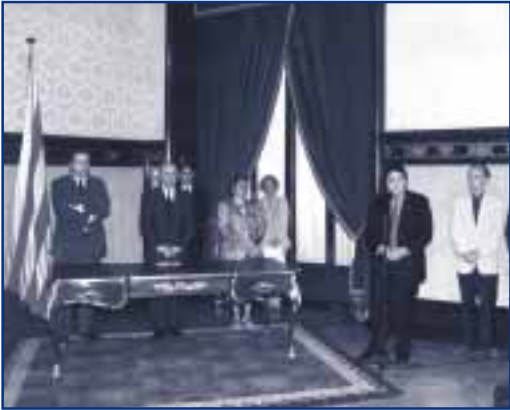
PRESA DE POSSESIÓ DELS MEMBRES DEL CAC

cés i informar-ne. Fins ara, els operadors que havien demanat noves llicències o un procés d'agrupament al Govern obtenien l'autorització directament perquè la llei ho permetia. Ara necessiten sotmetre's a un informe. En l'actualitat, qualsevol moviment que es produeix necessita passar pel Consell de l'Audiovisual i, per aquest motiu, darrerament hem demanat la compareixença d'alguns operadors, en el seu benefici, perquè aportin informació que el CAC considera imprescindible per poder opinar sobre aquests processos, com ara detalls sobre el seu projecte. I estem molt tranquils de dir al Govern el que diem perquè hem tingut tota la informació que necessitàvem. Som responsables del que hem fet, tant si és un sí com si és un no, a plena consciència, perquè hem tingut la possibilitat de dialogar i entrevistar-nos amb tots els afectats. A més a més, entre els operadors, superada la primera sorpresa, aquest procés també ha contribuït a la seva tranquil·litat.