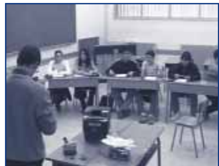
UNA CLASSE DEL CRÈDIT D'AUDIOVISUALS A L'INSTITUT VALL DE TENES

En definitiva es tracta d'una iniciativa que s'emmarca dins de les possibilitats que tenen les emissores de ràdio i televisions locals per potenciar tan la formació de nous professionals de l'audiovisual com la projecció de la tasca de formació d'aquests mitjans de comunicació entre la població. Tot plegat pot esdevenir un referent per altres cadenes.