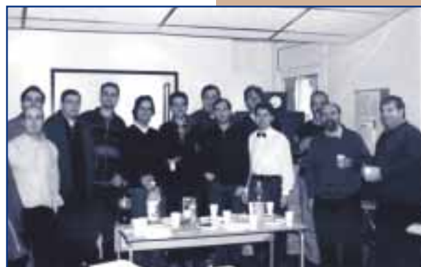
PARTICIPANTS I MEMBRES DE MICROFUSA CELEBRANT UN CURS IMPARTIT

Aquest centre de formació ha ofert cursos de tècniques de microfonia i àudio digital per al personal de l'emissora pública de Catalunya.