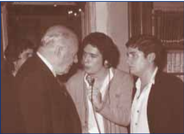
JOSEP PUIGBÓ ENTREVISTANT EL PRESIDENT TARRADELLAS

La inauguració oficial de Ràdio Olot es remunta a principis dels 50, anys durs de postguerra on no hi havia espai per expressions culturals diferents a la imposada pel règim franquista.